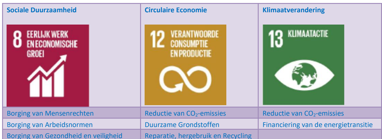
Overzicht 2: Uitwerking thematische speerpunten in subthema's behorende bij 4.4.1.(SDG 8) en 4.4.2. (SDG 12 en 13)

Daarnaast wil UVM extra nadruk leggen op een tweetal thema's. Het betreft klimaatverandering en circulaire economie. Het betreft doelstelling 12 en 13 van de Sustainable Development Goals (SDG's). Op deze thema's wil UVM ondernemingen op een positieve wijze stimuleren stappen te maken gerelateerd aan deze onderwerpen. Dit doet UVM door daar waar mogelijk en passend bij de beleggingsbeginselen, de thema's in de beleggingsportefeuille te verankeren. In onderstaand overzicht is een verdere uitwerking van deze thema's gegeven. Hierin is aangegeven op welke specifieke aandachtsgebieden UVM en de ondernemingen waarin wordt belegd invulling kunnen geven aan de thema's klimaatverandering en circulaire economie.